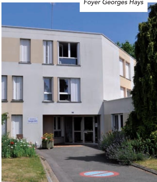
Foyer Georges Hays