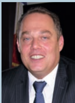
Maire de Lucé

►► La cloche a de nouveau sonné pour quelques 1600 élèves lucéens. Tous les services municipaux se sont mobilisés afin de leur assurer une très bonne année scolaire.