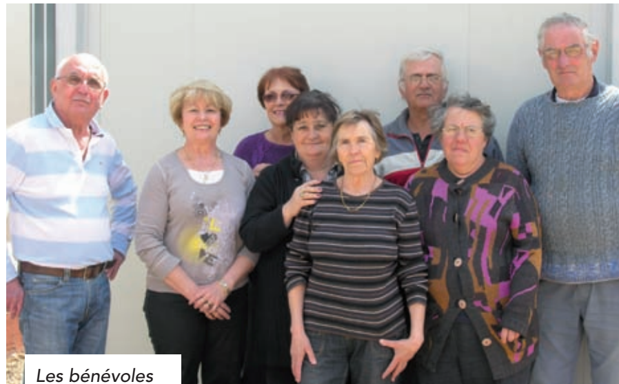
Les bénévoles des Restos

106 rue de la République 28110 Lucé Tél. : 06 47 99 20 83