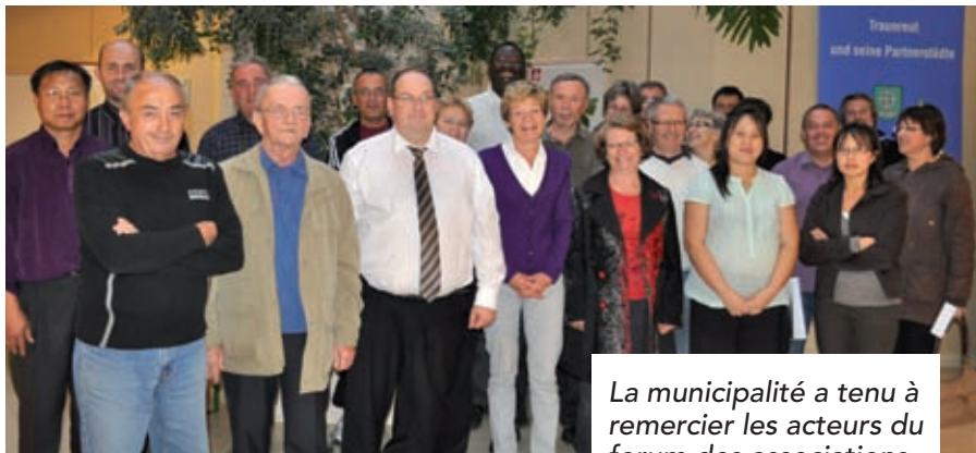
La municipalité a tenu à remercier les acteurs du forum des associations.

Durant la journée du dimanche 19 septembre agrémentée d'un temps exceptionnel, les Lucéens ont pu découvrir et rencontrer les responsables des associations sportives et socio-culturelles. C'est dans un village de tentes installées à l'entrée du stade et sur les installations sportives situées à proximité que s'est déroulée cette 1 ère édition. Je tiens à souligner la grande implication de tous les bénévoles et des services municipaux qui, à travers les activités et démonstrations proposées, ont permis la réussite de cette manifes-