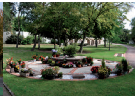
Columbarium et caves-urnes à Poiffonds