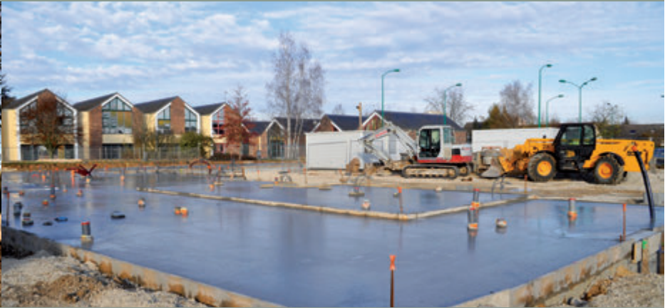
Fondations de la future crèche

qui empruntent la rue. Cette deuxième tranche représente un coût de 46 000 € auquel il convient d'ajouter les 35 000 € consacrés à la première tranche.