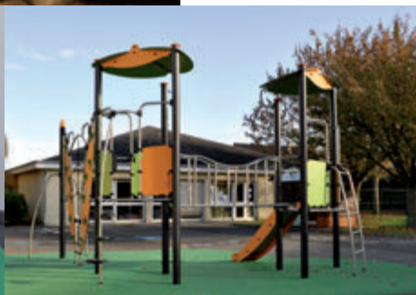
Tout-en-un à Vallée Loiseau