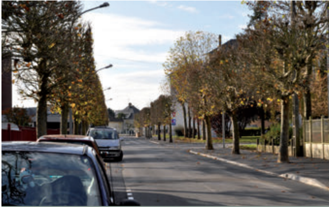
Réfection de voirie rue Jules Ferry (2 ème tranche)