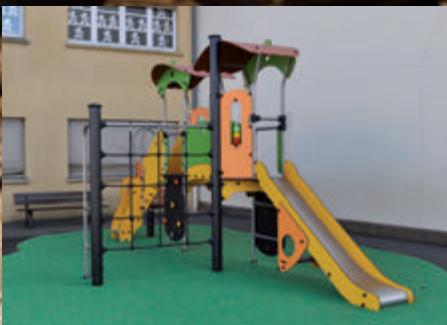
Jeux extérieurs à Jean Jaurès

Les trottoirs de la rue Jules Ferry, côté Lycée Philibert de l'Orme, ont été entièrement refaits à neuf cet été. Une deuxième tranche de travaux vient d'être réalisée de l'autre côté de la voie pour finaliser l'aménagement de l'ensemble. Des places de stationnement ont été créées à cheval sur le trottoir et sur la chaussée afin de réguler les flux de circulation et réduire la vitesse des véhicules