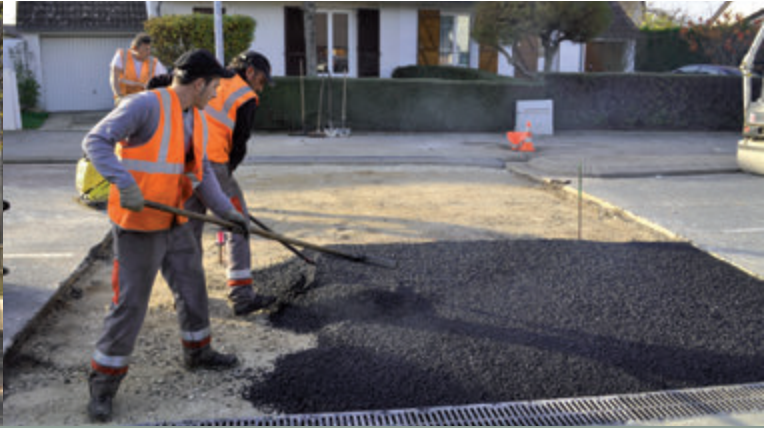
Création de deux ralentisseurs rue de Genève