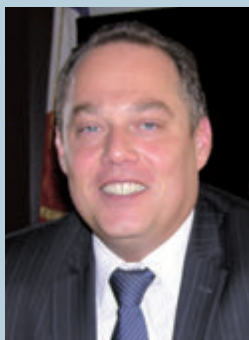
Maire de Lucé

►► Cette fin d'année est l'occasion de dresser un bilan des événements qui ont ponctué ces douze derniers mois.