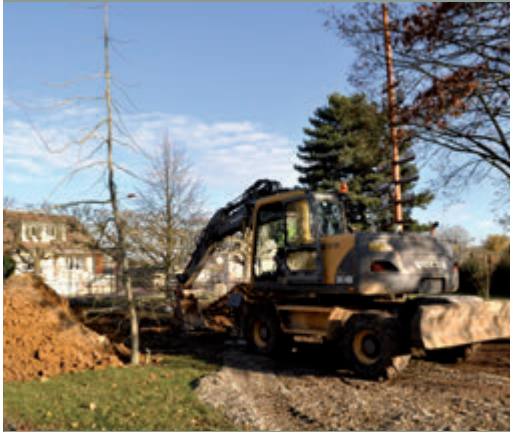
Assainissement autour de l'Hôtel de ville