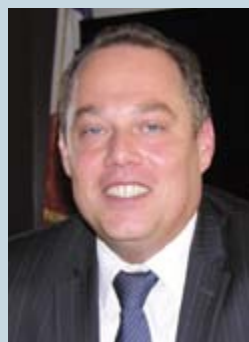
Maire de Lucé

▶▶ L'édition 2012 de la Fête de Lucé a été couronnée d'un vif succès.