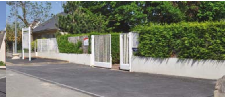
Remise à neuf des trottoirs impasse du nouveau cimetière