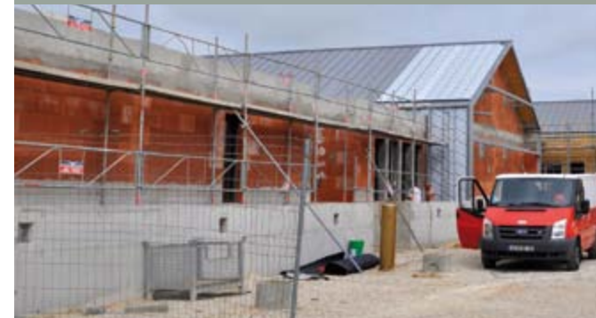
Chantier de la crèche