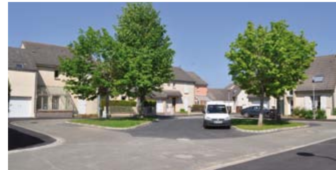
Réfection des trottoirs et de la placette rue Emile Zola