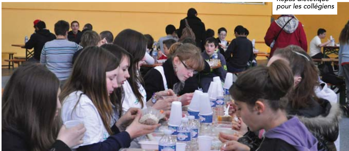
Repas diététique pour les collégiens

Ces événements, coordonnés par les centres sociaux de Lucé, ont été financés dans le cadre du dispositif santé des Contrats Urbains de Cohésion Sociale. ■