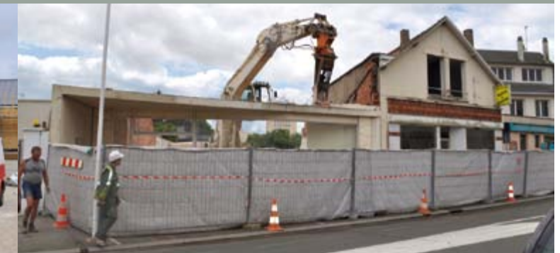
Déconstruction de l'Espace Culture