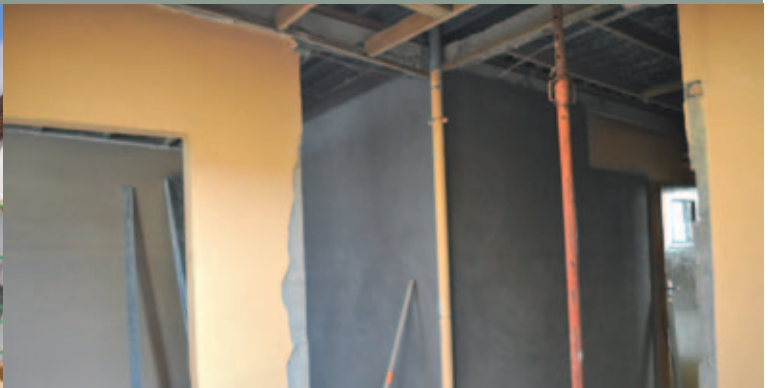
Réfection des vestiaires du gymnase Jean Boudrie

de l'école Pierre Mendès France, qui jouxte la crèche, a permis de procéder à la réparation de l'assainissement du réseau de l'école qui accusait la présence de racines d'arbres dans les canalisations. Cette extension a permis de créer 25 places de parking. Ce dernier bénéficiera d'un éclairage à LEDs, peu gourmand en énergie et dont la durée de vie est nettement supérieure à un éclairage classique. Coût global des travaux : 2 300 000 €