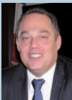
Maire de Lucé