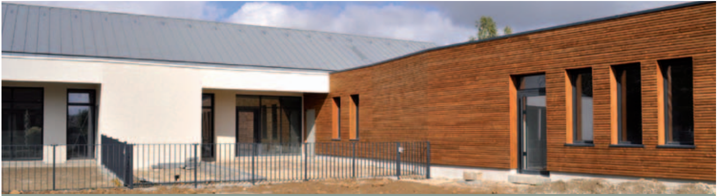
Crèche Les Lucioles