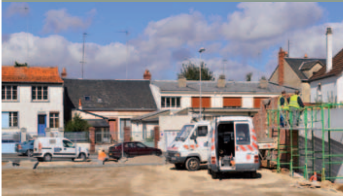
Création d'un parking - rue de la République